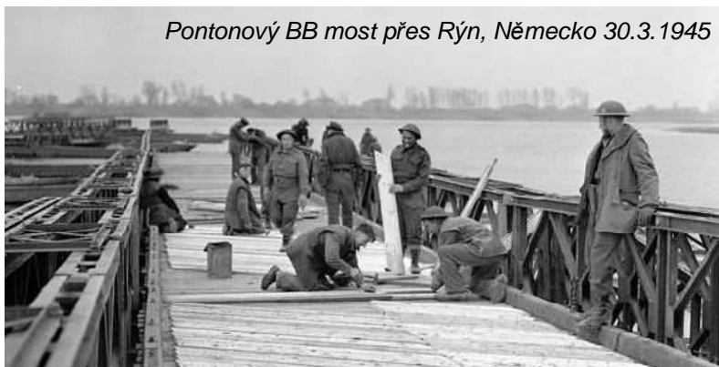
Pontonový BB most přes Rýn, Německo 30.3.1945

Zastupitelstvo na svém mimořádném zasedání dne 1.4.2013 schválilo záměr vybudovat u mostu na břehu řeky Čtyřkolskou říční minizoo. Celý prostor stávajícího parkoviště bude ohrazen a v řece vybudovány vodní kotce. Kromě stávajících nutrií budou dále vysazeni bobři, ondatry a vydry. U vchodu vznikne budka na výběr vstupného (20 Kč dospělí, 10 Kč děti). Pokladník a zároveň správce bude vybrán ve výběrovém řízení. Věříme, že tento záměr pomůže ke zvýšení turistického ruchu a příjmů obecního rozpočtu.