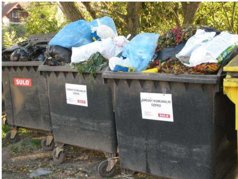
kontejnery náves Javorník