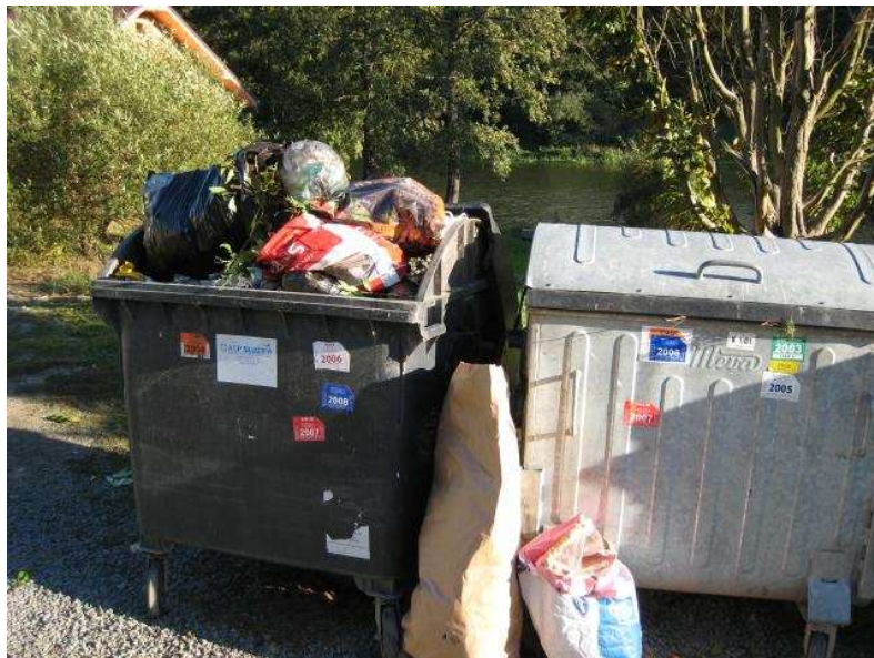
kontejnery u čističky