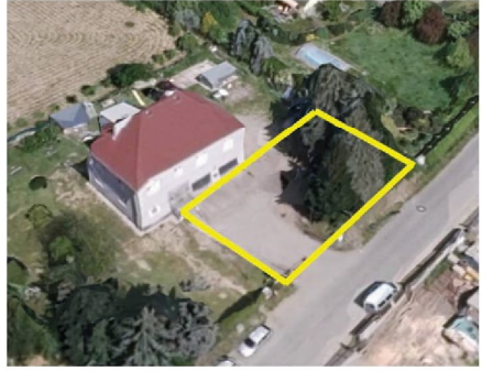
Autor: Správce Webu www.ctyrkoly.cz

V případě upřesňujících dotazů můžete kontaktovat přímo starostu obce: starosta@ctyrkoly.cz nebo tel. 774 439 474.