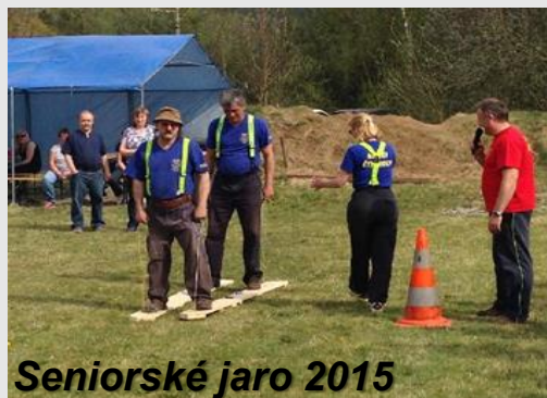
Seniorské jaro 2015

se do činnosti SDH Čerčany zapojil již jako dítě a ve věku 21 let byl v roce 1972 zvolen velitelem zásahové jednotky. V roce 1988 se stal velitelem okrsku, v roce 2004 členem SDH Čtyřkoly, kde byl zástupcem velitele zásahové jednotky. Je iniciátorem soutěže „Seniorské jaro“, která se pořádá od roku 2006 ve Čtyřkolech. Založila se tak tradice setkávání hasičů seniorů, kde si mohou nejen připomenout své hasičské dovednosti, ale i potkat dlouholeté přátele a druhy z okolních sborů.