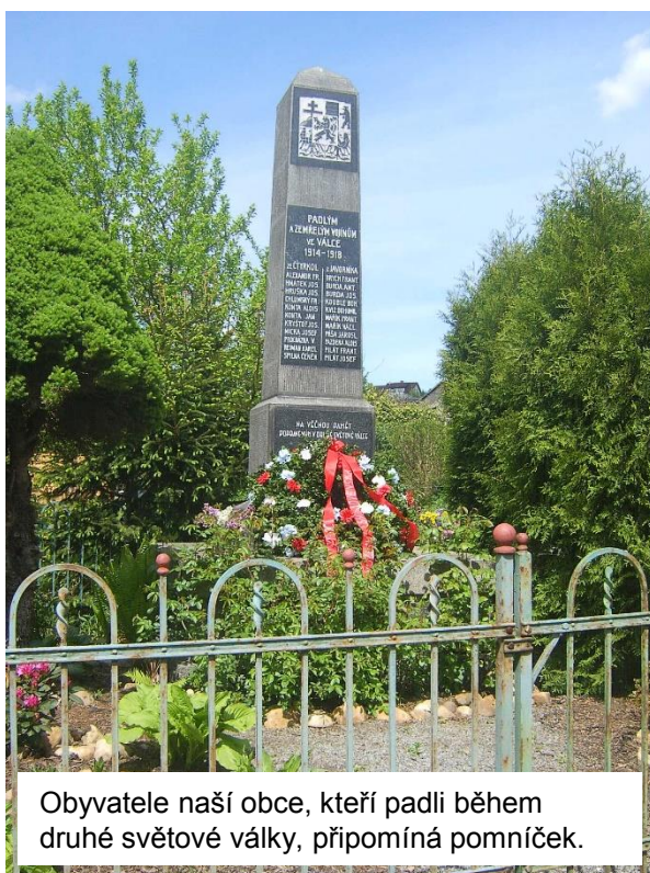
Obyvatele naší obce, kteří padli během druhé světové války, připomíná pomníček.