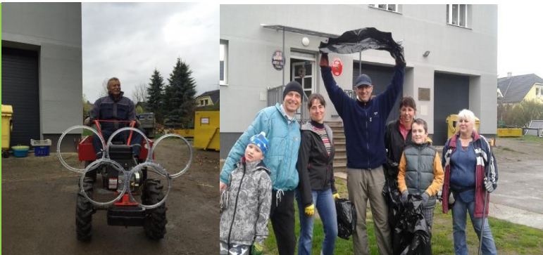
Pan starosta pojal úklid ve jménu Olympijského roku.

Věříme, že jste v rámci jarního gruntování nezapomněli ani na své okolí. Od úřadu se k úklidu veřejných prostor obce vydalo několik zastupitelů a jejich rodinných příslušníků