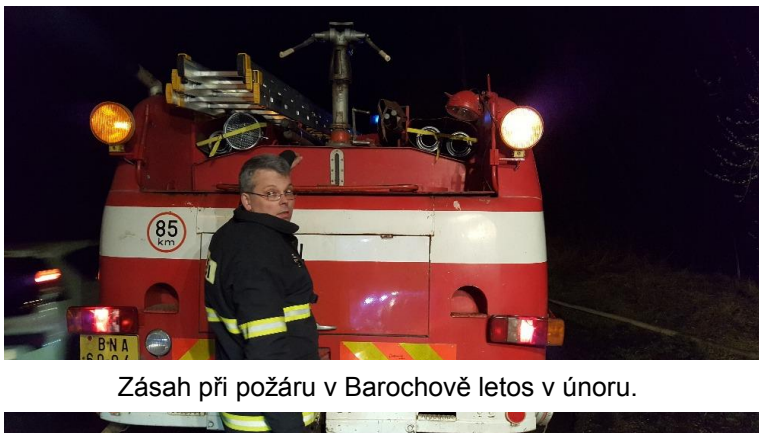
Zásah při požáru v Barochově letos v únoru.